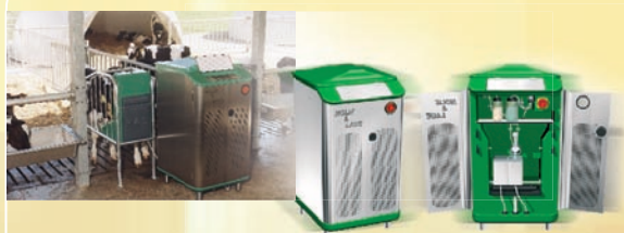
Kalvamma H&L 100