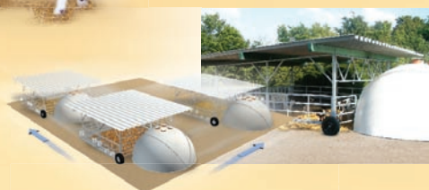
H&L Iglu Veranda