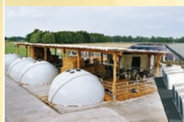
H&L Iglu Systemet