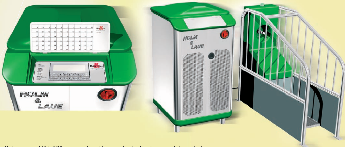
Kalvammen H&L 100 är en optimal lösning för lantbrukaren och hans kalvar.